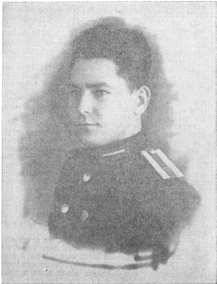
Курсант авиационного училища Герман Титов.