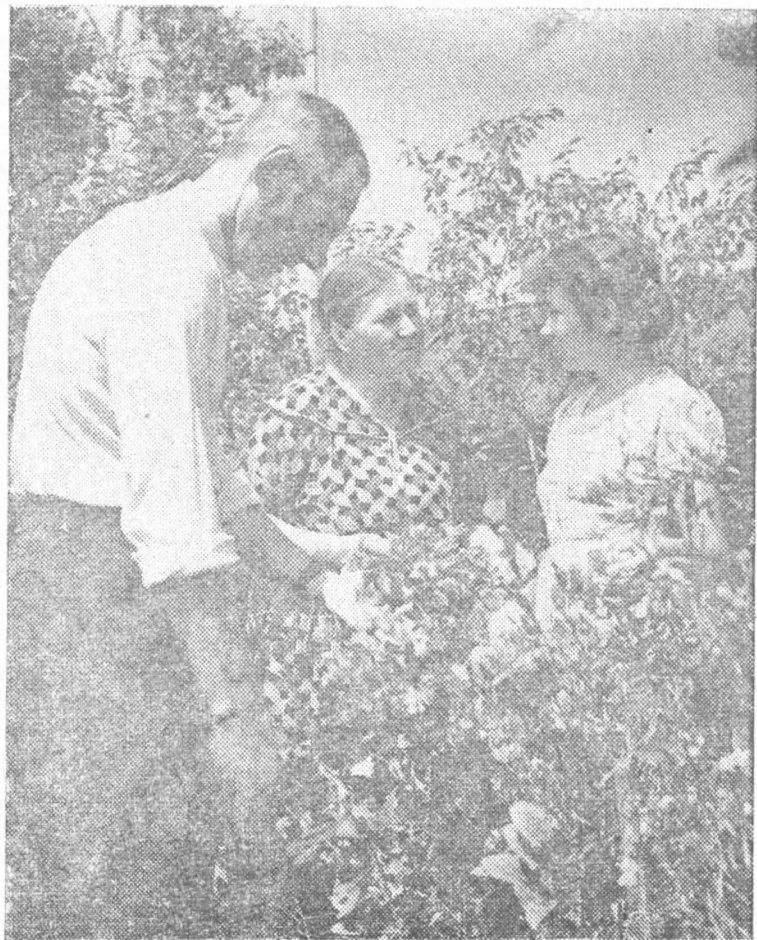
В семье Титовых все немножко садоводы.