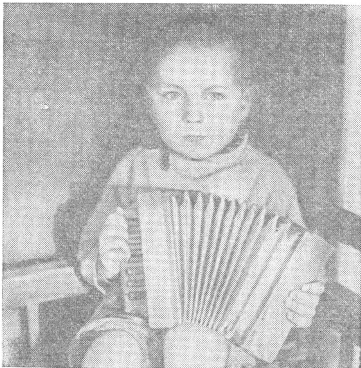
Первой забавой у Геры была гармошка.

Богатый оттого, что не жалея, щедро и до конца раздает себя людям. Счастливый оттого, что всюду после себя оставляет цветущие сады и ростки доброго, нового, честного в сердцах своих учеников.